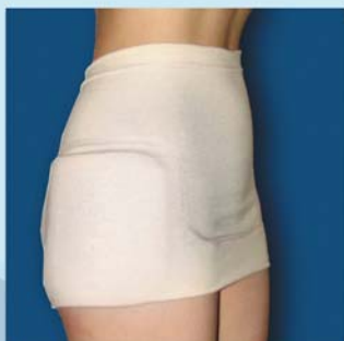
HipSaver® Nursing Home

עם מיפתח רגל רחב המאפשר הלבשה גם על חיתול